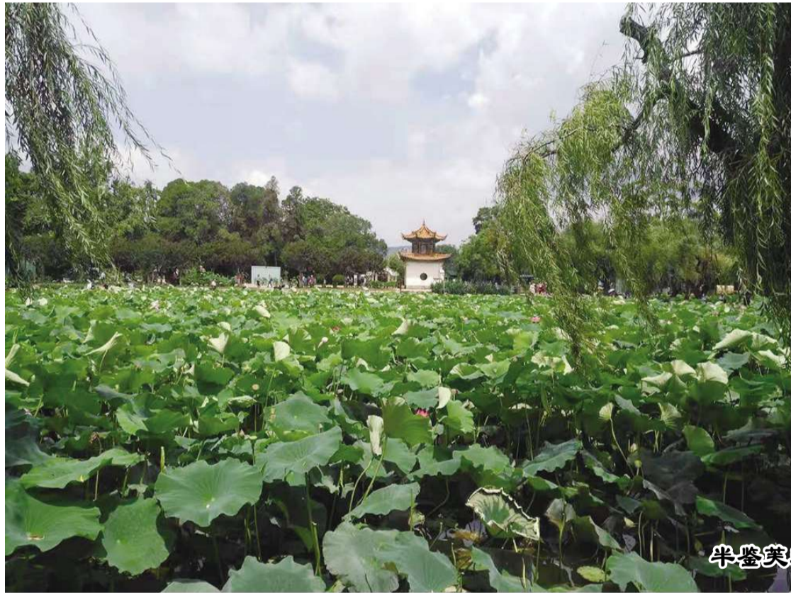
半壁芙蓉两行柳 一镇大观览滇池 望路

你们听，我们的护林职工开始巡山啦！大王叫我巡山，一路巡来一路欢，有流淌的河水，有悠闲的牛羊，保护生态责任重，绿水青山就是我们的希望！